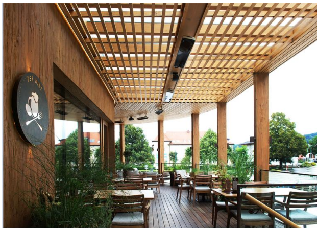
Optisches Highlight auf der Hotelterrasse