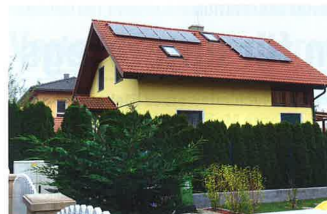
Ursprünglich hatte Karl Fuchs auf seinem Dach in Ost-West-Richtung eine PV-Anlage mit 4,5 kWp. 2012 kamen 2,5 kWp dazu. Der erzeugte Strom wird hauptsächlich für die IR-Heizung und Luft/Luft-Wärmepumpe genutzt – Überschuss ins Netz eingespeist

Raumklima der IR-Heizung, gingen auch die Energiekosten zurück. Die Rechnung des Stromanbieters zeigt vom Juni 2013 bis Juli 2014 einen Verbrauch von 5.688,10 kWh mit Stromkosten (inklusive Netzgebühren usw.) von 1.062,52 Euro. Fuchs: „Da ist alles dabei, allgemein verbrauchter Strom, Warmwasser und Heizen.“ Und freut sich über zusätzliche 201,29 Euro, die er für ins Netz eingespeiste 3.096,20 kWh PV-Strom erhielt. Dazu erspar ich mir die Gaskosten von Rund 800 Euro pro Jahr dazu noch Leitungs- und Zählermiete sowie 68 Euro für den Rauchfangkehrer.