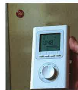
Per Raumthermostat easymultiroom Funk wird die IR-Heizung gesteuert

Raumklima der IR-Heizung, gingen auch die Energiekosten zurück. Die Rechnung des Stromanbieters zeigt vom Juni 2013 bis Juli 2014 einen Verbrauch von 5.688,10 kWh mit Stromkosten (inklusive Netzgebühren usw.) von 1.062,52 Euro. Fuchs: „Da ist alles dabei, allgemein verbrauchter Strom, Warmwasser und Heizen.“ Und freut sich über zusätzliche 201,29 Euro, die er für ins Netz eingespeiste 3.096,20 kWh PV-Strom erhielt. Dazu erspar ich mir die Gaskosten von Rund 800 Euro pro Jahr dazu noch Leitungs- und Zählermiete sowie 68 Euro für den Rauchfangkehrer.